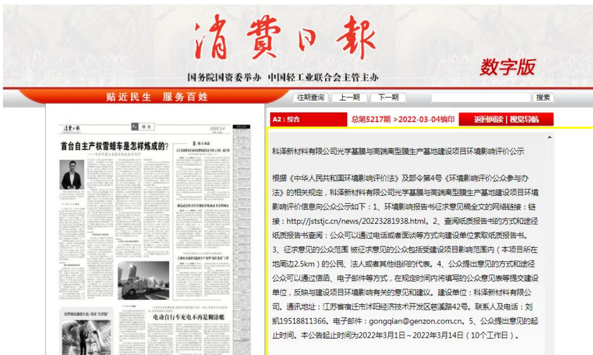
图 3.2-3 建设项目项目环境影响评价公示（第二次）报纸截图