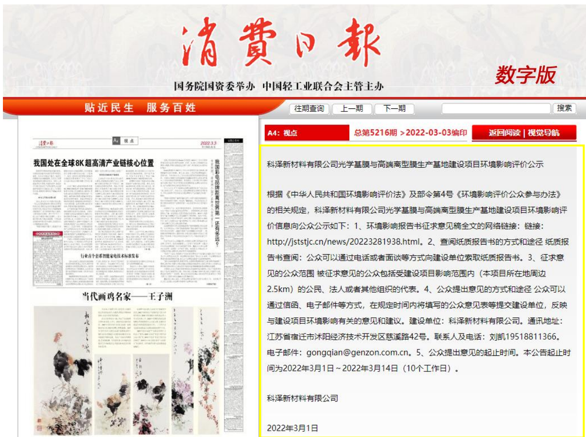
图 3.2-2 建设项目项目环境影响评价公示（第一次）报纸截图